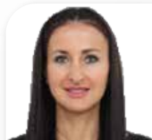
Проф. д-р АНГЕЛИНА ВЛАХОВА

Биологична перспектива в денталната имплантология